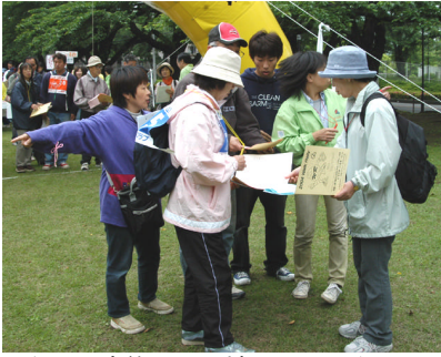
スタート直後にコマ地図チェック