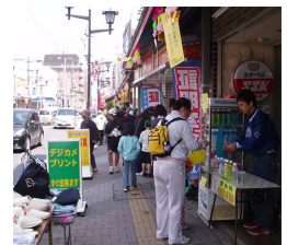
各コースにワゴンセールが

コマ地図を頼りに武蔵野の自然や歴史を巡り、見る・触れる・遊ぶの体験的な課題に挑戦!グループで協力しながらウォークを進めます。春の狭山路を十分にお楽しみください。さらに参加者には、商品券(当日有効の買物券)で特別ワゴンセールや模擬店などの楽しみがいっぱいです。