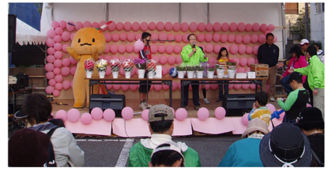
ゴール会場には、模擬店やステージ、パフォーマンスなどが盛り沢山です