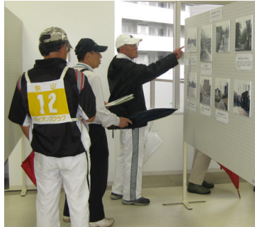
チェックポイントで課題を確認