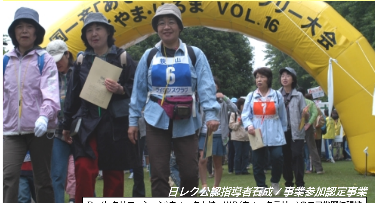
日レク公認指導者養成 / 事業参加認定事業

Rec(レクリエーション)ウォークとは...WR(ウォークラリー)のコマ地図に現地の写真やウォーク対象の地域がエリアマップまたはルートマップとして描かれ、課題の「見る、触る、体験」を十分楽しめる新しいウォーキング・ゲームです。