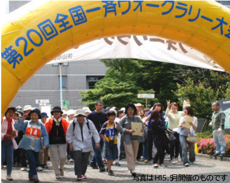
写真はH15.9月開催のものです